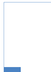
Kopffeld 114 × 36 mm