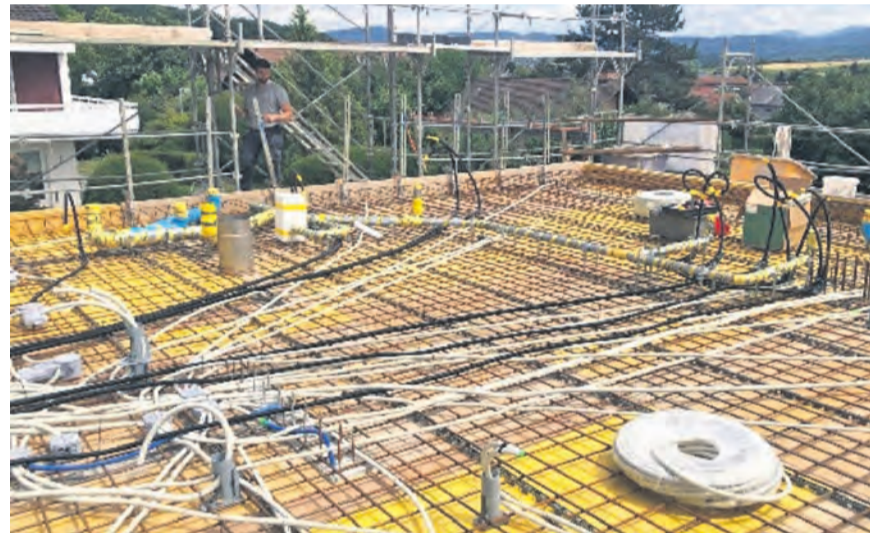
Neubau mit unseren Installationsrohren.